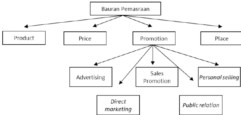
Gambar 2 Bauran Pemasaran dan Bauran Promosi